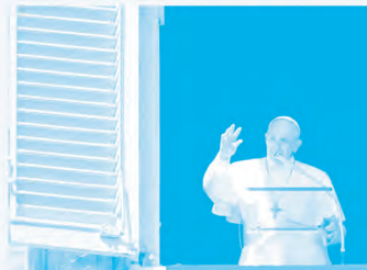
Durante el Ángelus de este domingo, el papa Francisco dijo que en Nicaragua se mantienen “importantes conversaciones” para resolver la crisis.